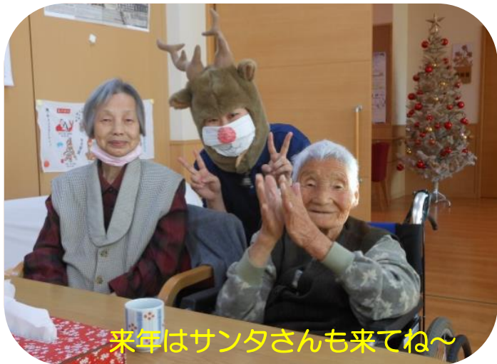
来年はサンタさんも来てね～