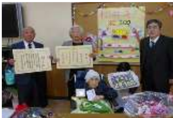
<長男様ご夫婦・入野町長と記念撮影>