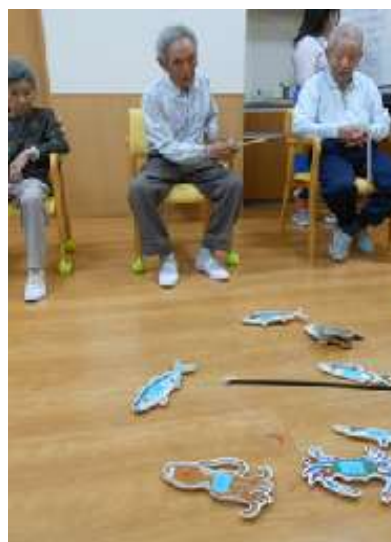
「今夜の肴かな・・・」