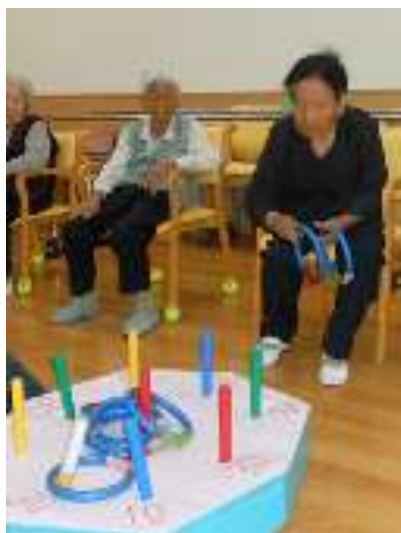
「しっ、真剣な眼差し・・・」