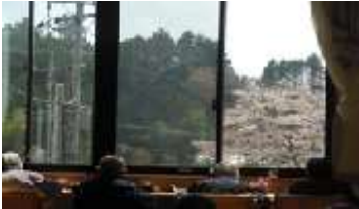
ユニットから、見える樹齢50年?の桜